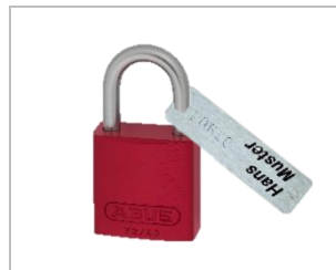
Dauerhafte und eindeutig Bezeichnung des Mitarbeiters